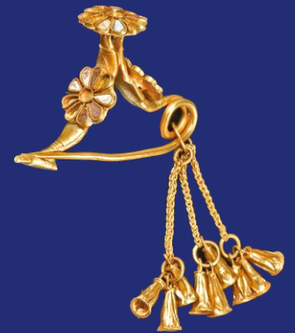
L'esclusiva fibula d'oro a forma di arco rovesciato di Kition (Cipro)

All’evento hanno partecipato anche i membri ciprioti della Rotta dei Fenici a Cipro: L’Ente per il Turismo di Nicosia, l’Ente per il Turismo di Larnaka, l’Ente Regionale per il Turismo di Pafos e l’Istituto Marino e Marittimo di Cipro CMMI, che hanno ricevuto il Diploma del 20° anniversario. A questo importante evento hanno partecipato anche numerose delegazioni di altri Paesi della Rotta dei Fenici.