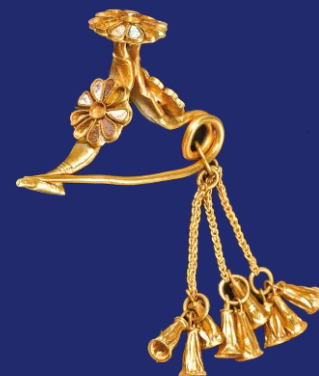
L'esclusiva fibula d'oro a forma di arco rovesciato di Kition (Cipro)