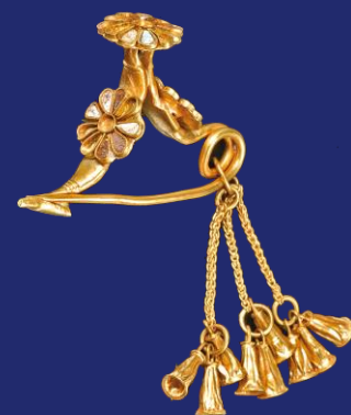
L'esclusiva fibula d'oro a forma di arco rovesciato di Kition (Cipro)