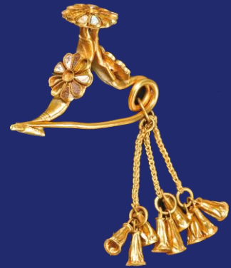
L'esclusiva fibula d'oro a forma di arco rovesciato di Kition (Cipro)